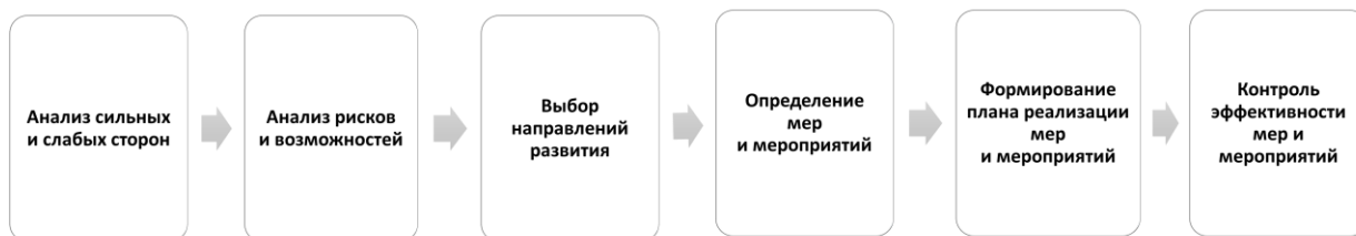
Рисунок 3. Планирование комплексного развития ДОО

Адресные рекомендации экспертов и других участников МКДО позволяют выстроить качественный управленческий цикл и спроектировать дорожную карту развития организации.